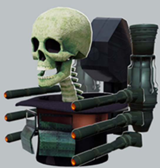
MR. SKULL HAT